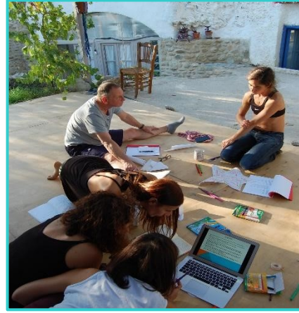
Fotografías del primer encuentro transnacional de profesionales.