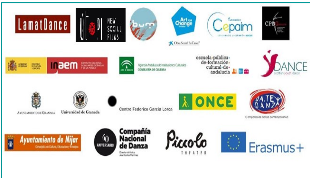
Red de colaboradores de Asociación Cía. Danza Vinculados.

Asimismo, mantener una estructura como Asociación Cía. Danza Vinculados, que pueda ofrecer servicios de calidad tanto a nivel artístico, como educativo y social, implica la participación de un gran equipo de profesionales. Por eso, agradecemos el imprescindible apoyo de personas, instituciones y empresas que colaboran con nuestra entidad.