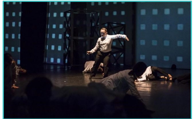
Fotografías de la puesta en escena de “Del Sacromonte a Nueva York”.