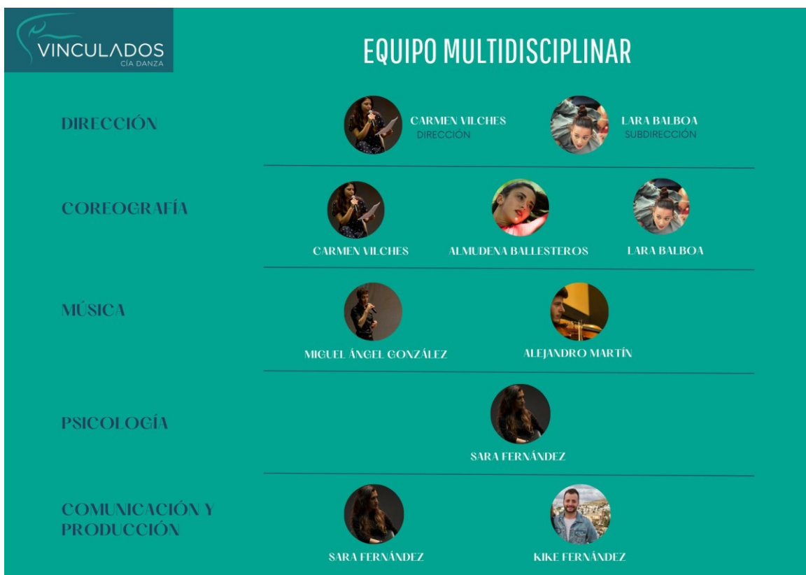
Organigrama de Asociación Cía. Danza Vinculados.

Asociación Cía. Danza Vinculados cuenta con un amplio equipo multidisciplinar de coreógrafas, bailarinas, docentes, psicólogas, investigadoras, colaboradores y músicos, que trabajan de manera conjunta para desarrollar la labor inclusiva, artística, docente y de investigación de la organización.