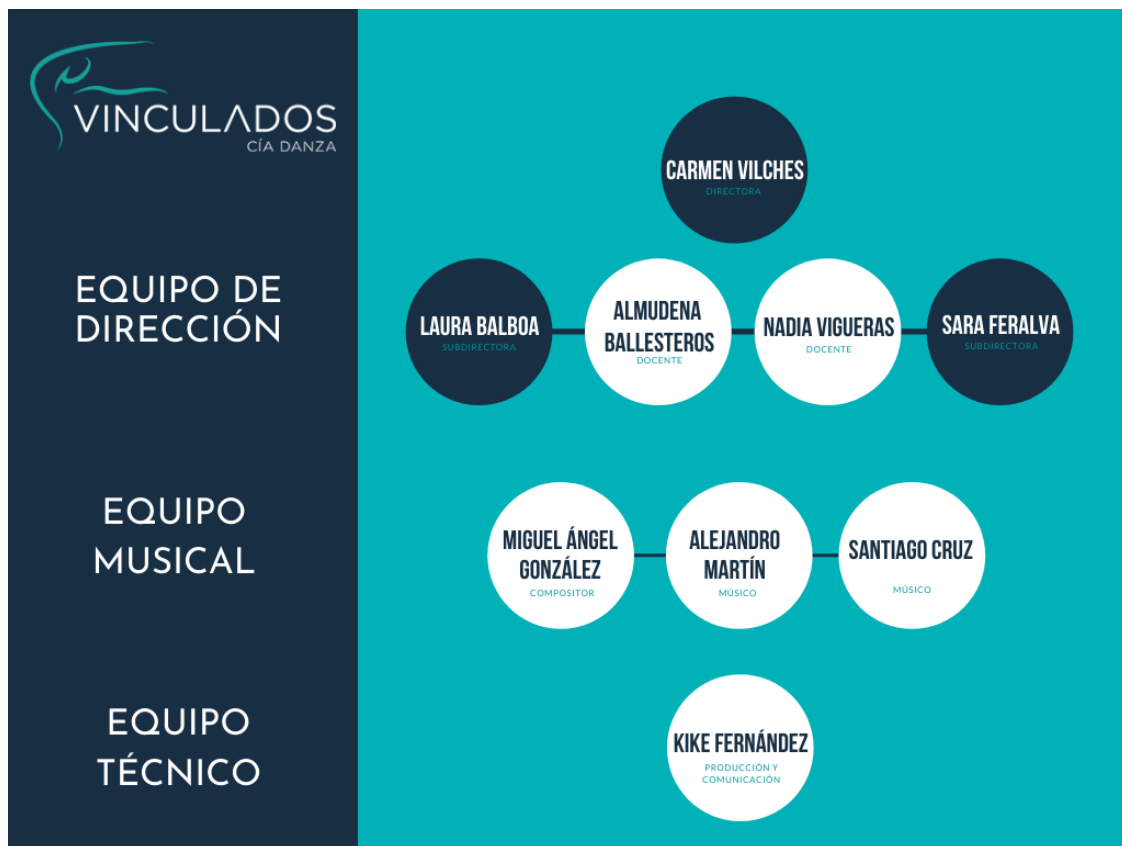
Organigrama de Cía. Danza Vinculados.

Cía. Danza Vinculados cuenta con un amplio equipo multidisciplinar de coreógrafas, bailarinas, docentes, colaboradores y músicos, que trabajan de manera conjunta para desarrollar la labor artística inclusiva de la asociación.